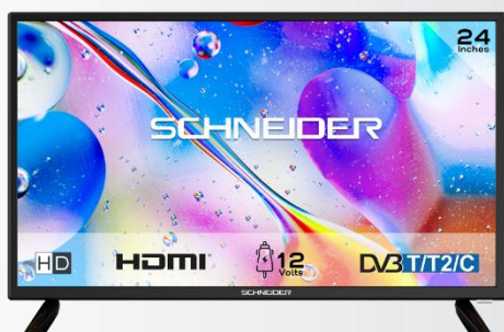
SCHNEIDER TV HD 12 Volt 24" / 60 cm

Élégant et polyvalent, ce téléviseur offre toutes les caractéristiques pour apprécier un bon moment de cinéma.